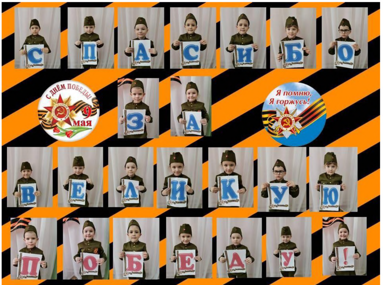
Акция «Окна Победы»